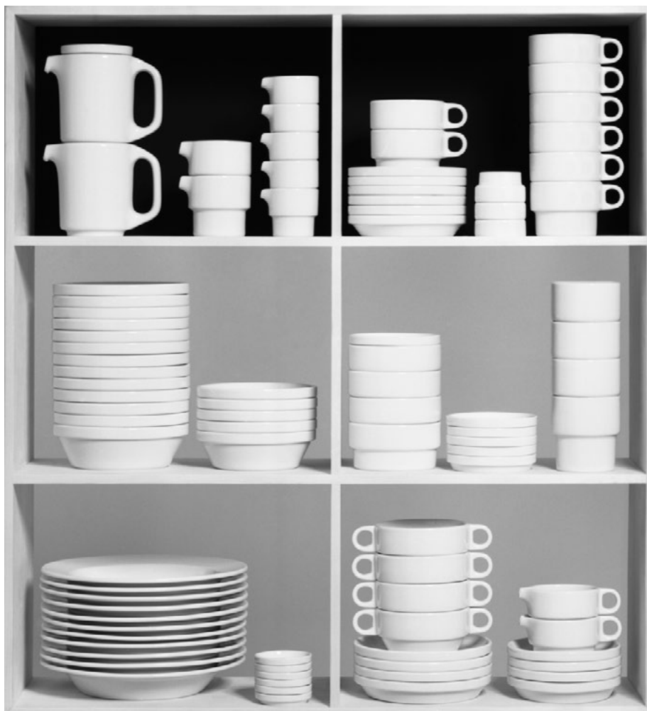
Wolfgang Siol: Stapelgeschirr TC 100, 1961. Diplomarbeit aus dem Jahr 1959 von Hans (Nick) Roericht, Abteilung Produktgestaltung.

Auch im Lauf des 20. Jahrhunderts haben sich solche Spannungen keineswegs aufgelöst. Anhand verschiedener Gegenstände untersuchen die Beiträge unseres Themenheftes „Fotografie und Design“ vielmehr, in welcher Weise sich industrielle und künstlerische Produktionsweisen miteinander vermitteln ließen. Reproduktion ist hierbei ein konzeptueller Schlüssel, um die beiden von uns im Titel des Heftes verkop-