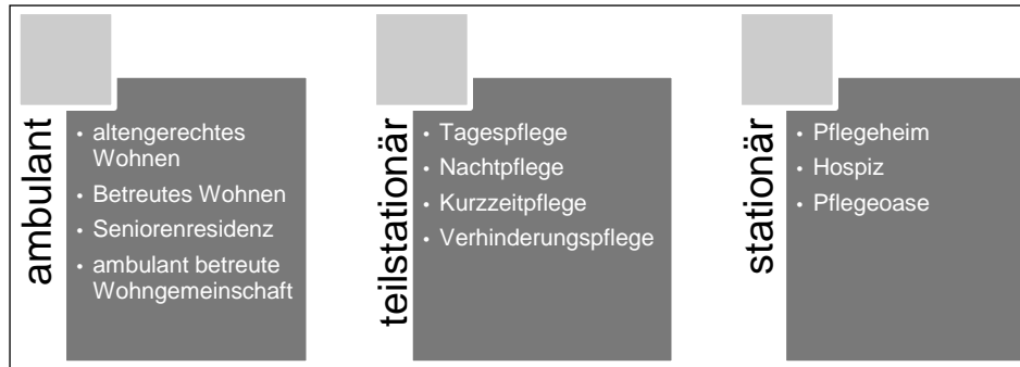
Abbildung 2 - 1 Spektrum der Seniorenimmobilien 13